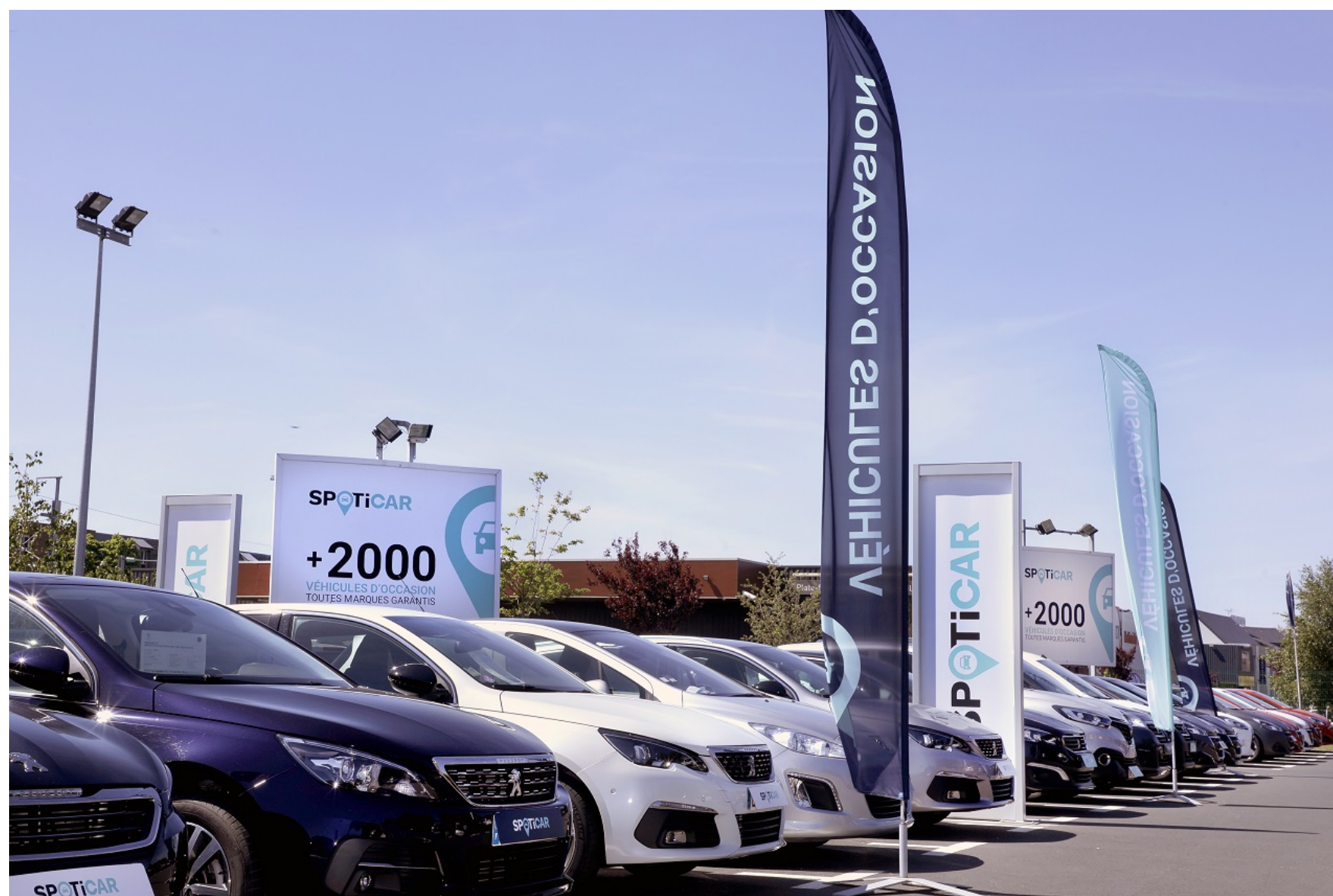
Tous les sites en propre de Stellantis pourront désormais réaliser des ventes à distance avec SelliWay de Bee2Link.

DISTRIBUTION Par Gredy Raffin, le 05/07/2021